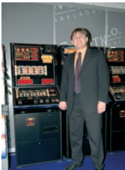
p. Hajný (Ir Game)

grafikou a zcela novým pojetím bonusových her s použitím videosekvencí. Dále také vystavovala klasické válcové přístroje FRUIT POKER, LUCKY BINGO, ROCKET REELS a POWER PLAY, GOLD LINES, které jsou dodávány v obou programových verzích za velmi přijatelné ceny.