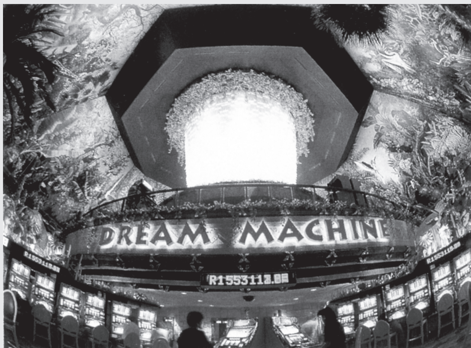
Výherní automaty Dream Machine v Jungle Casinu. Jackpot ve výši 1 533 113 randů by v červnu 2001 představoval 10 871 791 Kč

V roce 1969 navázal spolupráci s největším místním pivovarem South African Breweries a založil Southern Sun Hotels, který vycházel vstříc rostoucímu turistickému ruchu. Za následujících 14 let se společnost rozrostla z původních šesti až na 30 luxusních hotelů s víc než 5000 pokoji. Kerznerovy společnosti