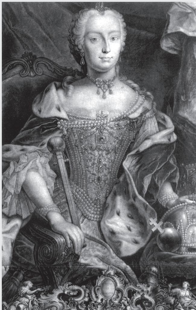
MARIE TEREZIE česká a uherská královna a rakouská vévodkyně 1740 – 1780

hojně a zvláště vysoké sázky. Organizovali je příčinlivci, kteří na podniku značně bohatli. Janovský dóže se nehodlal smířit s myšlenkou, že peníze z těchto sázek plynou jinam než do dóžecí pokladny, a proto v roce 1610 (podle některých pramenů až v roce 1620) požádal o pomoc svého poradce, janovského bankéře jménem Benedetto Gentile. Ten pak přišel s myšlenkou nahradit devadesát jmen pouhými čísly, a to proto, aby se oblíbené hry napětí mohly nejen jedenkrát ročně k původnímu účelu, ale častěji a hlavně – otevřeně za a o peníze! Loterie nového typu se šířila rychlostí