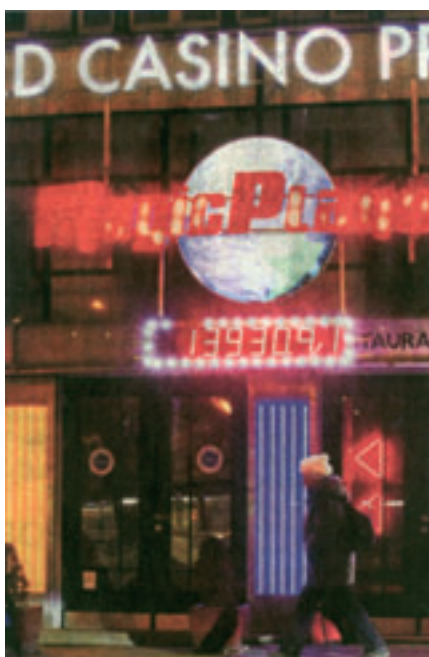
Plán primátora vyhnat hrací automaty do čtvrti hazardu se starostům městských částí příliš nezamlouvá. Na svém území by soustřeďovat herny chtěl jen málokdo.

někde na okraji Prahy, tak si to možná dokážu představit. Rozhodně ale ne v městské části, nebo snad dokonce v jejím centru,“ uvedl Klíma.